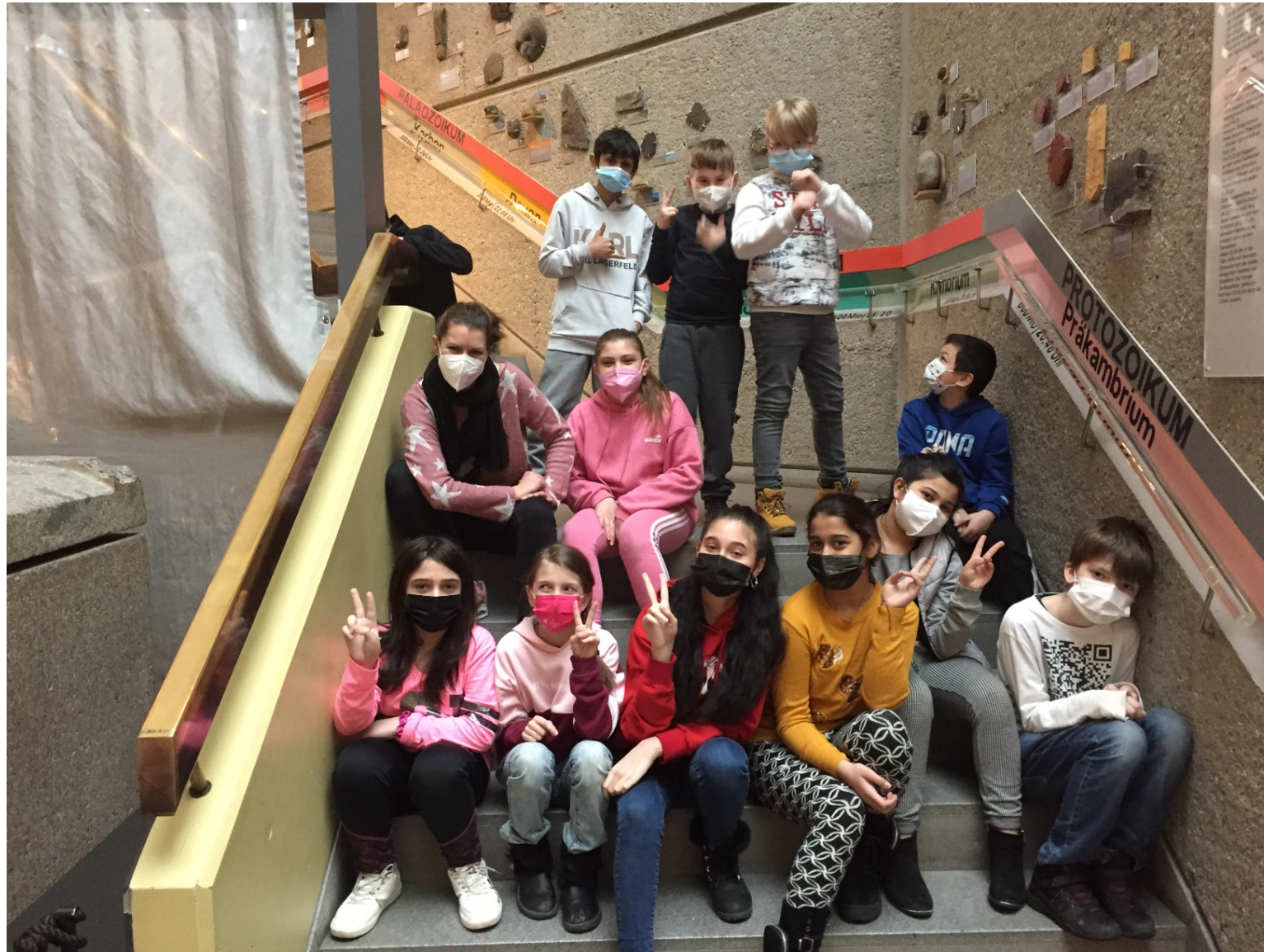
Klasse 4/5 auf Eiszeit-Safari im REM